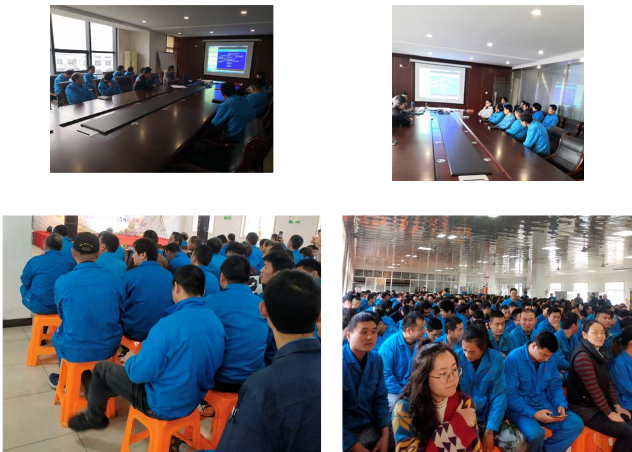
图 3.2-1 各类培训活动

公司每年针对实际和市场形势，识别各部门的培训需求，制定员工培训规划和年度计划，开展职工教育培训，包括质量意识、质量知识、管理制度、专业知识等培训内容。公司每年制定并下发了《年度培训计划》等，对质量诚信教育进行了安排布置。