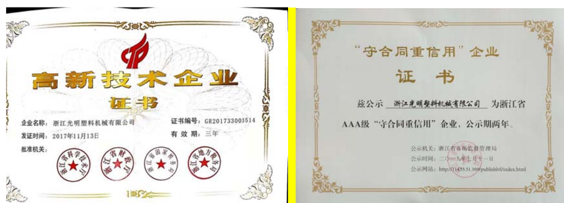
图 3.3-1 社会认可的证书（示例）

则。公司每年销售交易额翻倍增长，公司从不违约，也从不因为价格、质量、交货期、收付款等问题与客商发生过纠纷，深受国内外客户的信赖。为此，公司先后获得政府颁发的“安全生产标准化三级企业”、“高新技术企业”、“浙江省商标品牌示范企业”、“浙江省名牌产品”、“浙江省商标品牌示范企业”、“浙江省管理创新试点企业”、“浙江省服务型制造示范企业”、“浙江省 AAA 级守合同重信用企业”、“舟山市两化融合示范企业”等荣誉，如图 3.3-1 所示：