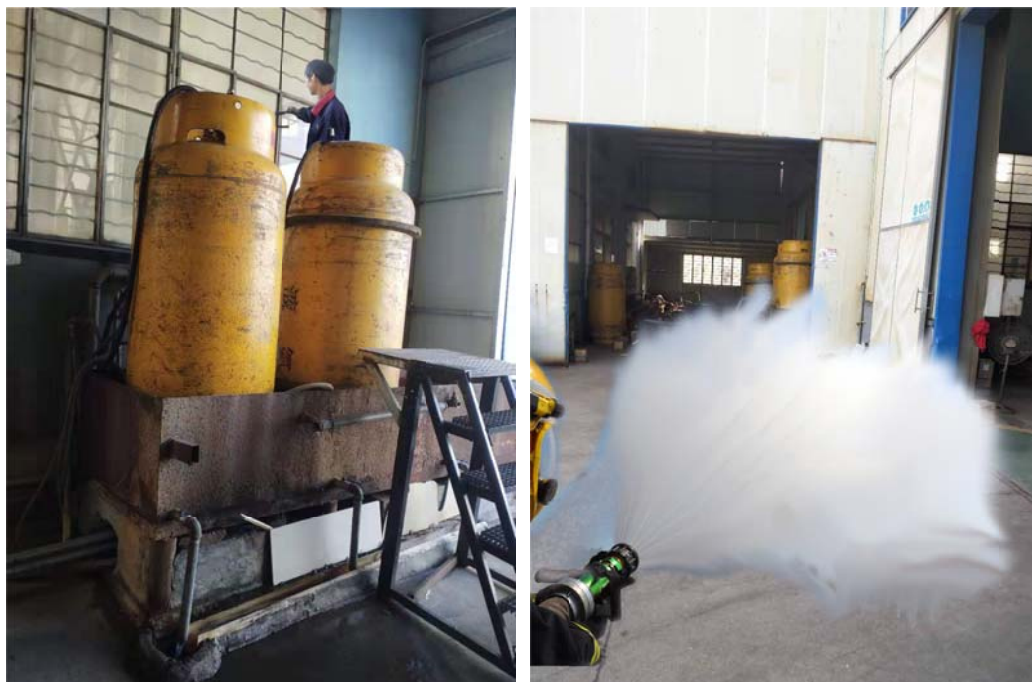
图 6.3-01 消防应急演练现场

等，对火灾、机械、触电等均有相应的应急措施，并成立了应急指挥中心和应急救援专业组。