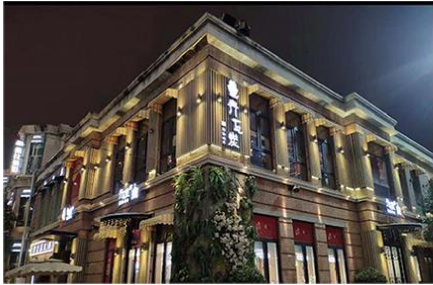
公司客户武汉市知名连锁餐饮企业青瓦炭实现疫后良性运营