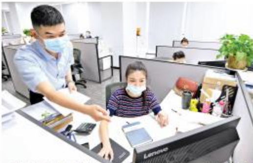
武汉市东湖区小微企业融资服务中心工作人员正在为商户提供服务。

市东湖区小微企业融资服务中心,以小微企业融资服务中心为载体,以小微企业融资服务中心为载体,以小微企业融资服务中心为载体。