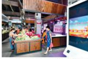
9月8日,武昌区长虹生鲜市场在转型升级后正式亮相,市场内干净整洁,服务惠及周边5万居民。