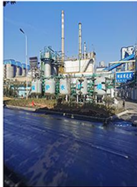
公司客户湖北金润德环保技术有限公司项目建设现场如火如荼开展